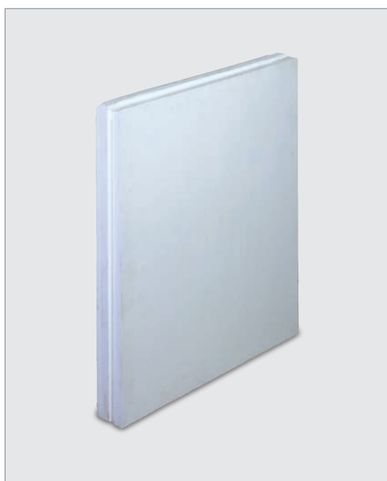
بلوک گچی ۷ سانتی‌متری