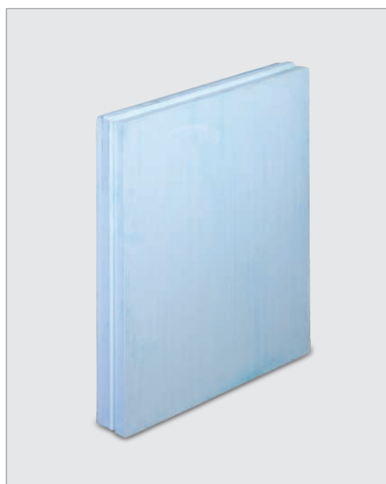
بلوک گچی ۸ سانتی‌متری MR (مقاوم در برابر رطوبت)